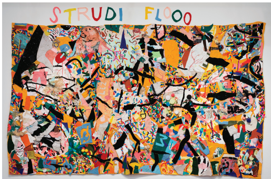
Trenton Doyle Hancock, Strudi Flooo , 2002, técnica mixta sobre fieltro